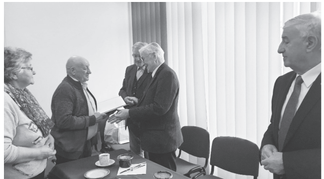
Państwo Chodak wraz z zarządem SIMP

Spotkanie przebiegło w miłej i przyjaznej atmosferze.