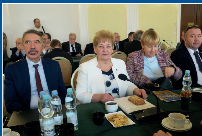
W obradach uczestniczyli członkowie CKR FSNT-NOT