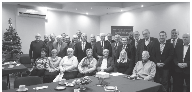
Uczestnicy spotkania świątecznego w Oddziale SIMP w Rzeszowie